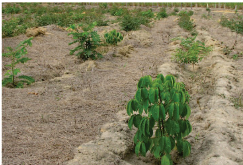
Figura 11 – Plantio de mudas com preparo do solo (subsolagem).