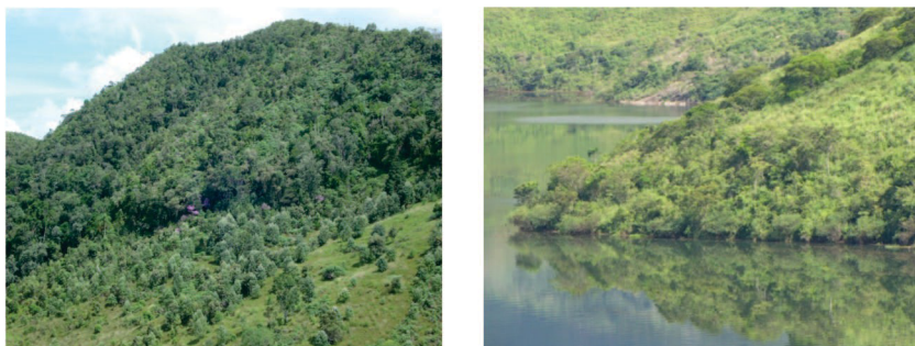
Figura 1 – Regeneração natural da floresta em pastagens abandonadas.

A restauração passiva, ou seja, sem intervenção direta, configura-se como a forma de mais baixo custo e mais ecológica para se promover o retorno das florestas nativas em áreas que foram removidas ou degradadas no passado (Figura 1).