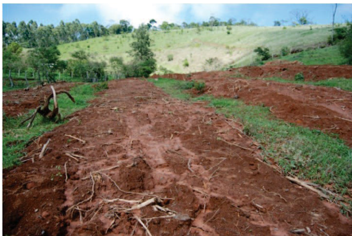
Figura 2 – Transposição de solo rico ( topsoil ) em faixas. Fonte: Acervo pessoal do autor.

Cabe destacar que a retirada de solo e serapilheira de matas nativas é mais indicada em áreas que o licenciamento ambiental autorizou a supressão da vegetação, para atividades como mineração, abertura de estradas, construção de reservatório hídrico para geração de energia, etc. Para a retirada desse material em matas nativas conservadas, na forma de Reserva Legal, por exemplo, é necessário consultar o órgão ambiental competente.