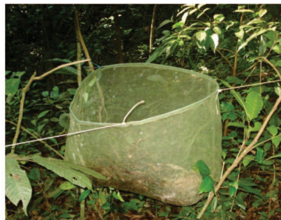
Figura 5 – Diferentes tipos de coletores de sementes instalados em florestas nativas para posterior transposição da chuva de sementes para áreas degradadas.