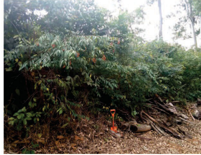
Figura 4 – Transposição de galharias de eucalipto.