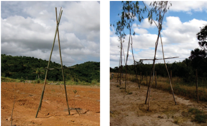
Figura 7 – Poleiros confeccionados com bambu ou varas de eucalipto.

Para que os poleiros sejam mais eficientes como formadores de núcleos de regeneração em áreas de pasto de braquiária, algumas recomendações devem ser seguidas, como: a limpeza da área de influência do poleiro, ou seja, fazer a capina da braquiária em toda a área abaixo do poleiro e a instalação dos poleiros apenas em paisagens que existam, ainda, florestas remanescentes (MARTINS, 2013).