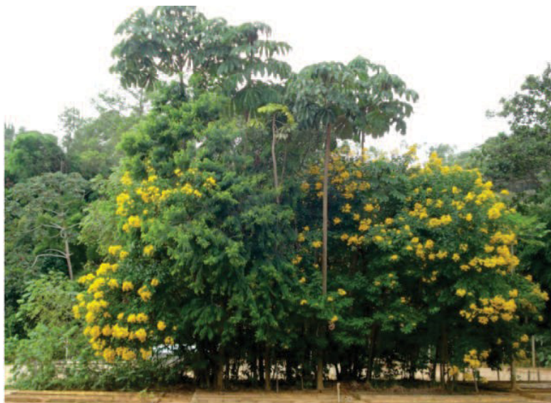
Figura 3 – Experimento de transposição de solo e serapilheira.