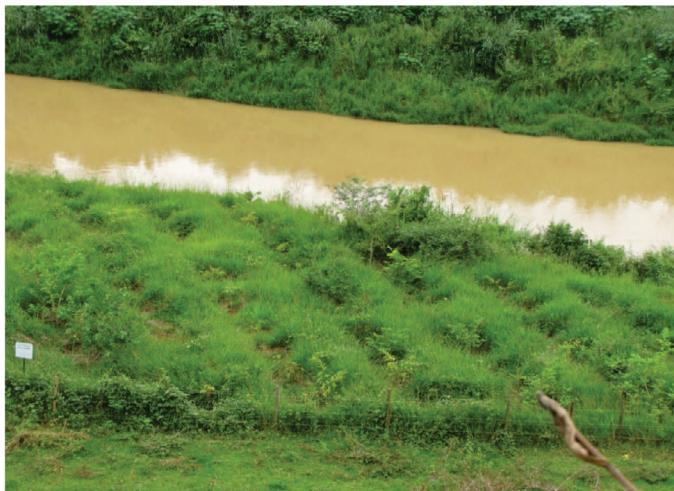
Figura 9 – Restauração de mata ciliar com plantio em área total, detalhe da forte competição da braquiária com as mudas.

As etapas do reflorestamento incluem: o combate a formigas cortadeiras, com aplicação de micro-porta-iscas, o controle de gramíneas agressivas pela aplicação de herbicidas, roçada e coroamento ao redor das mudas e a adubação de plantio (Figura 10). A adubação de plantio varia em função da fertilidade do solo, mas as adubações mais utilizadas são de 150 g a 200 g por cova de NPK 6-30-6 ou 4- 14-8. Em área com solo muito compactado recomenda-se o preparo do solo com abertura de sulcos profundos por meio do uso de subsolador tipo Ripper (Figura 11).