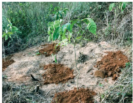
Figura 6 – Plantio de mudas em núcleos.