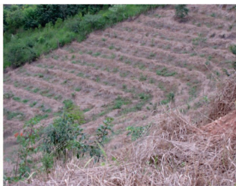
Figura 10 – Reflorestamentos com espécies nativas em área total. A – Controle da braquiária com coroamento ao redor das mudas; B - Erradicação da braquiária com aplicação de herbicida.