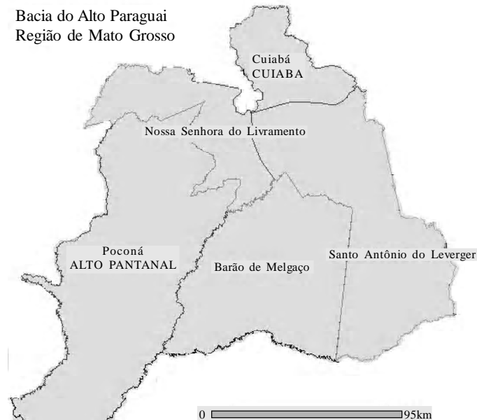
Figura 01. Mapa de localização dos Municípios em estudo

Neste contexto, esta pesquisa visa identificar nestas comunidades o uso de plantas com potencial de cura para agravos dermatológicos. Entretanto na região em estudo há algumas pesquisas que citam plantas utilizadas para este fim dentre elas destacam-se: Pott & Pott (1994), Souza (1998), Wobeto (2001), Amorozo (2002) e Macedo et al. (2002).